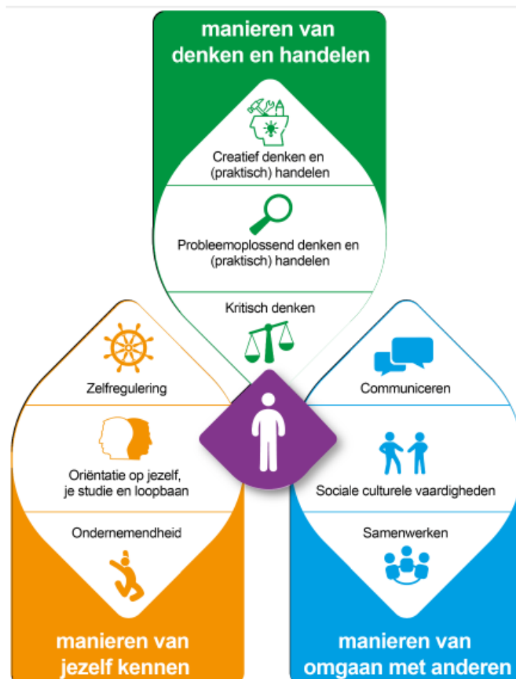
Figuur 3. Het model brede vaardigheden van Curriculum.nu

Het leergebied Bewegen & Sport draagt op veel vlakken bij aan brede vaardigheden (zie figuur 3). Soms gaat het alleen om bijvangst als de docent er in zijn lessen niet bewust op stuur. Als leraren wél doelbewust aandacht besteden aan brede vaardigheden in de beweegactiviteiten, dan is er sprake van een bijdrage. Leergebiedoverstijgende opbrengsten worden alleen gerealiseerd bij een schoolbrede aanpak, wanneer leerlingen op meerdere plekken op de school daarmee in aanraking komen. De brede vaardigheden staan altijd naast en in relatie tot 'beter leren bewegen'. Ze kunnen niet zonder elkaar, maar de brede vaardigheden zijn geen doel op zich. De brede vaardigheden moeten wel een duidelijkere positionering krijgen in het curriculum, omdat de samenhang zo overduidelijk is.